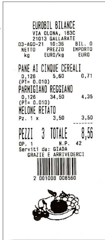
Esempio stampante cumulativa printer example